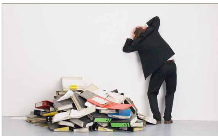
Juste un gros coup de fatigue ou bien plus que cela: il serait préférable de réagir avant le burn-out ou l'arrêt de travail.

C'est plus facile d'approfondir, lorsqu'on se connaît soi-même, lorsqu'on connaît ses compétences et ses faiblesses, ses valeurs et ses besoins. Il faut également savoir se remettre soi-même en question et se demander ce qui,